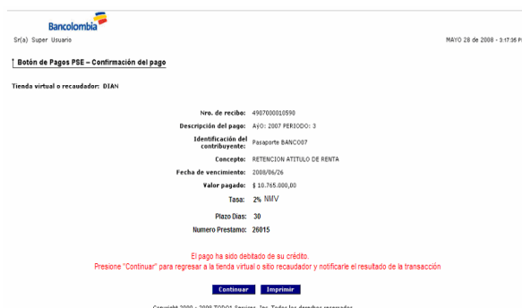
Imagen 4. Confirmación del pago

17. ¿Como se debe diligenciar el plazo para la utilización del Cupo de Credipago Virtual? Usted deberá diligenciar el plazo en días en los que desea cancelar la obligación generada por concepto del pago de impuestos. Para los clientes de la Banca de Empresas y Gobierno es de gran importancia contar con una negociación previa de estos días con su Gerente de Cuenta de tal manera que se pueda sostener la tasa pactada para el pago de la obligación.